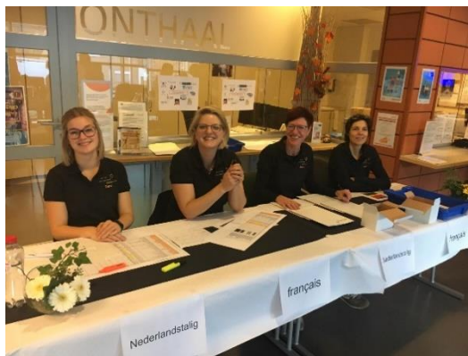
Journée d'étude en ergothérapie